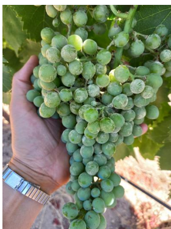
Symptômes d'oïdium sur grappe