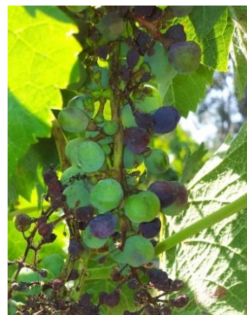
Rot brun sur grappe