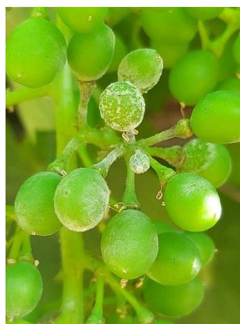
Symptômes d'oïdium sur grappe

Evaluation du risque : Après le stade fermeture de la grappe, la vigne devient moins sensible à l'oïdium. Mais si le champignon s'est manifesté avant ce stade, il peut quand-même continuer sa progression jusqu'à provoquer l'éclatement des baies, entraînant par la suite l'apparition de pourriture grise ou acide. De nombreuses parcelles se trouvent encore à un stade très sensible.