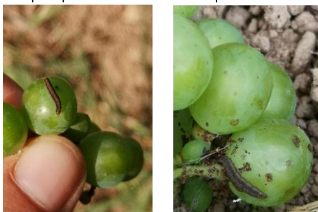
Larve de Cryptoblabes sur baie

Evaluation du risque : Faible à moyen en général, fort localement.