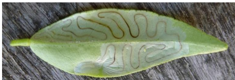
Galeries de mineuse

Directeur de publication : Jean Marc VENTURI Président de la Chambre d'Agriculture de Corse 15 avenue Jean Zuccarelli 20200 BASTIA Tél : 04 95 32 84 40 Fax : 04 95 32 84 49 Site Web : chambragri2b.fr