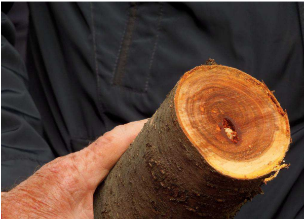
Galerie larvaire d' A. bungii dans le bois de cœur