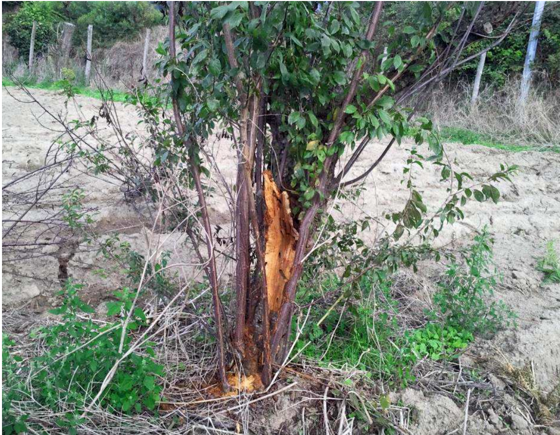
Arbre infesté par Aromia bungii avec des galeries larvaires dans le bois et de la sciure au pied.