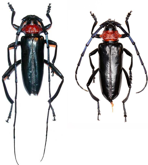
Aromia bungii au stade adulte : mâle (à gauche) et femelle (à droite)