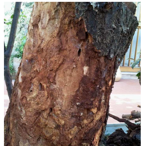
Galleries forées dans un tronc d'arbre par Aromia bungii .

Les voies potentielles d'introduction sont le bois et les produits faits de bois, les matériaux d'emballage en bois et les plants de pépinières de Prunus spp.