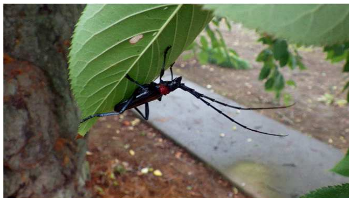
Aromia bungii adulte, face inférieure d'une feuille de Prunus spp.