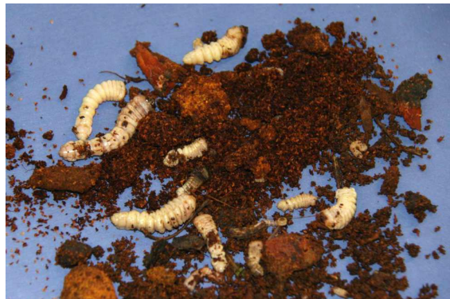
Larves d' A. bungii avec sciure