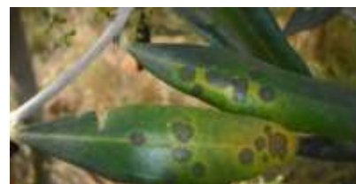
Photo 2 : Taches symptomatiques des contaminations dues au champignon F. oleagineum

Observations : surveiller l'apparition sur les feuilles âgées de taches dues aux contaminations du printemps précédent.