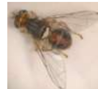
Photo 1 : B. oleae

En dessous de 14 à 16°C l'activité de la mouche sera ralentie.