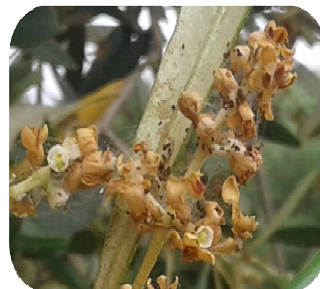
Photo 4 : Monticello le 31 mai 2018, fils de soie enserrant les fleurs qui se fanent sans avoir pu être fécondées