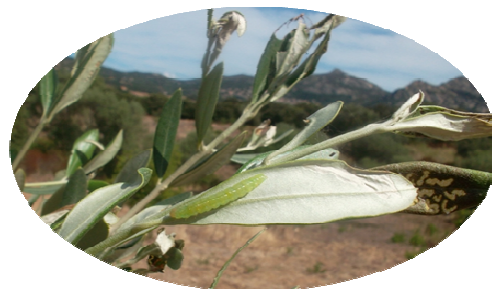
Photo 5 : pyrale et dégâts caractéristiques sur feuilles dans la partie terminale d'un rameau

Évaluation du risque : sa présence n'a pas encore été signalée, les conditions climatiques actuelles ne semblent pas particulièrement favorable à l'activité de l'insecte. Continuer la surveillance.