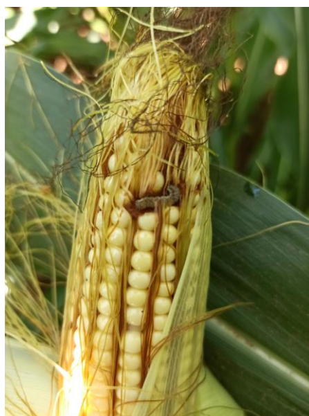
Héliothis installé dans un épi

Seuil de nuisibilité : 20 chenilles / m 2