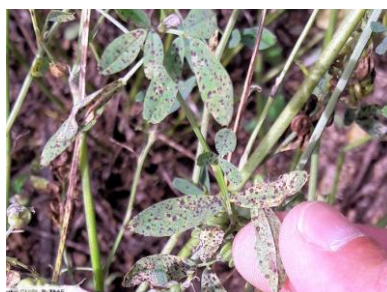
Symptômes de Pseudopeziza sur feuilles de luzerne