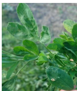
Symptômes de LEV et momie de puceron

Evaluation du risque : peu d'incidence sur la production