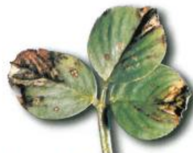
Symptômes foliaires du pepper-spot. Photo Luzerne référence