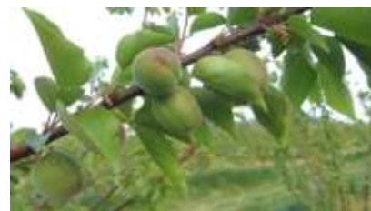
Stade jeune fruit

stade grossissement du fruit ; le durcissement du noyau est atteint sur les variétés très précoces.