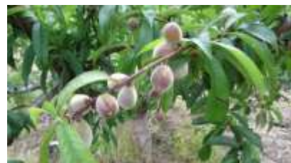
Stade jeune fruit

Stade jeune fruit à grossissement des fruits