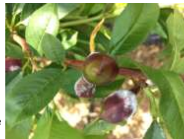
Tache d'oïdium sur nectarine

Evaluation du risque : Le stade de sensibilité est en cours sur abricot et pêche/nectarine. Les conditions climatiques à venir (pluie, hausse des températures) sont favorables au développement du champignon.