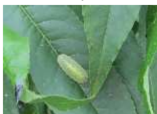
Larve de Syrphé sur pêcher

Evaluation du risque : Observer vos vergers.