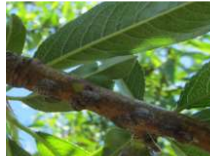
Présence de boucliers sur rameau

Évaluation du risque : attendre la migration des larves.