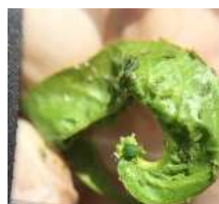
Foyer de pucerons observé à la loupe