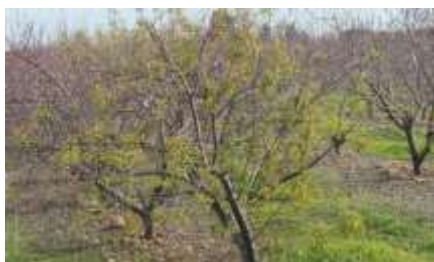
ECA sur abricotier

Les arbres infestés présentent des risques de contamination pour le reste du verger et mettent en péril sa pérennité: elle peut détruire jusqu'à 5% des arbres du verger chaque année. Ce phytoplasme est transmis par le psylle, cacopsylla pruni .