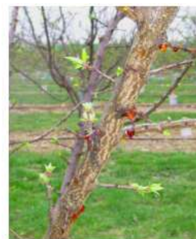
Écoulement de gomme sur abricotier

Évaluation du risque : la période de sensibilité débute au stade « gonflement des bourgeons ».