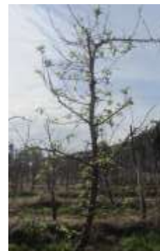
ECA sur prunier

La lutte contre cette maladie est obligatoire par arrêté préfectoral en date du 16 mai 2014 sur les communes de Borgo, Vescovato, Venzolasca, Sorbo Ocagnano, Castellare di Casinca, San Giulianu, Canale di Verde, Linguizzetta. Elle impose l'arrachage et la destruction des arbres contaminés.