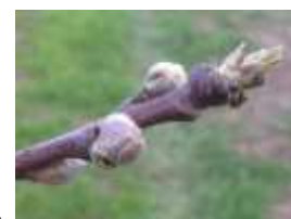
Stade pointe verte

Stade pointe verte pour les variétés à débournement très précoce (Early bomba).