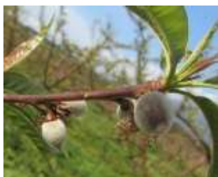
Petit fruit (Star Princess)