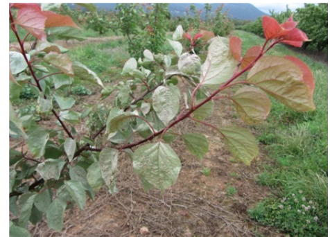
Symptôme de plomb sur abricotier

Gestion du risque : détection des arbres atteints avant la chute des feuilles afin de limiter la contamination via les outils de taille.