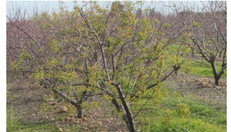
ECA sur abricotier

Gestion du risque : Avant la chute des feuilles, repérer les arbres atteints et les éliminer pour éviter de poursuivre la contamination : brûler l'ensemble des branches ou charpentières atteintes. Si l'arbre est fortement touché, l'arbre sera abattu et brûlé.